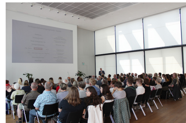
Der Schlaganfalltag lockt viele Besucher in den Bürgersaal.