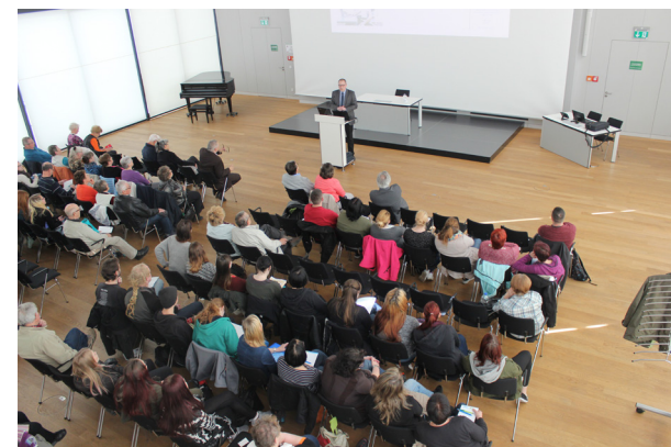
Der Schlaganfalltag lockt viele Besucher in den Bürgersaal